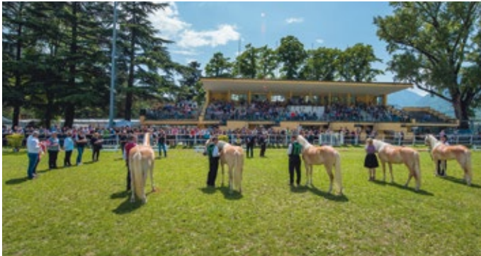
Bei der Südtiroler Stammbucheintragung treffen sich Züchter aus Nah und Fern, sie gilt als größte Jungstutenschau der Haflingerrasse

Die Stammbucheintragung der dreijährigen Jungstuten veranschaulicht die Zuchtentwicklung in Südtirol äußerst eindrucksvoll, sie gilt als eine der bedeutendsten Herdebuchveranstaltungen innerhalb der Rasse. Einheitliche Rahmenbedingungen bieten beste Voraussetzungen für eine weitgehend objektive Beschreibung und Beurteilung der jungen Pferde. Die Strahlkraft dieser Traditionsveranstaltung ist beachtlich.