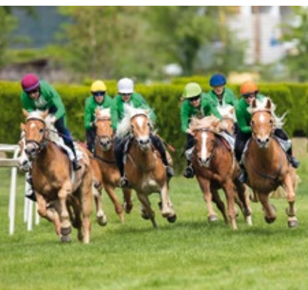
Das traditionelle Haflinger-Galopprennen am Ostermontag in Meran zieht jedes Jahr Tausende Zuschauer an

Die Südtiroler Jungstutenschau 2019 im Rahmen der Stammbucheintragung in Neumarkt und die Haflinger-Jubiläumsschau des Haflingerzuchtvereins Sarntal in Sarnthein sind aus züchterischer Sicht die herausragenden Ereignisse des heurigen Frühjahrs. Aus pferdesportlicher Sicht hingegen zieht das Haflinger-Galopprennen am Ostermontag mit Sicherheit wieder das Interesse Tausender Zuschauer auf sich. Dazwischen reihen sich noch weitere Veranstaltungen ein, die alle gemeinsam den Stand der Südtiroler Haflingerzucht im Jahr 145 seit Begründung der Rasse veranschaulichen werden.