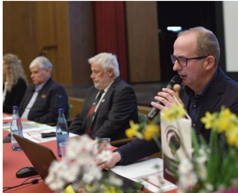
Die ordentliche Jahresvollversammlung wird heuer im Haus der Vereine in Kardaun abgehalten

Wichtig! Vorstellung und Ringzuteilung erfolgen nach einem genauen Zeitplan.