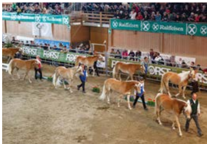
L'iscrizione al Libro Genealogico altoatesino funge anche da metro di giudizio per la selezione Haflinger internazionale

Delle iscrizioni delle puledre, da effettuare entro e non oltre sabato 21 marzo, si occupa direttamente l'ufficio di LG, tel. 0471